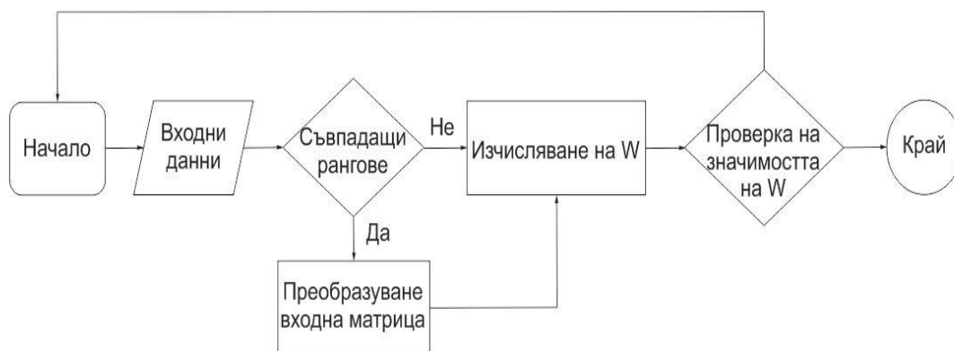
Фиг. 4.2. Адаптиран алгоритъм за определяне съгласуваността на експертите