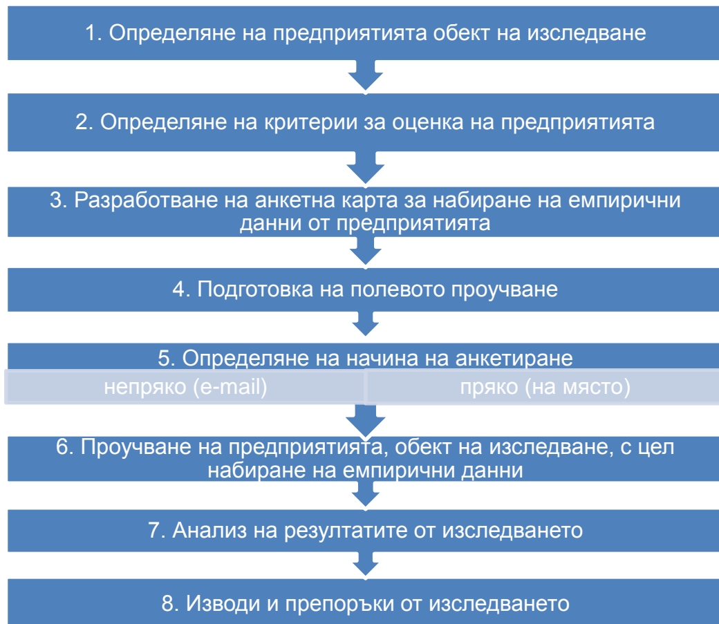
Фиг. 2.1. Структура и елементи на подхода за изследване на въздействието на програмната подкрепа върху конкурентоспособността на МСП

На тази основа е предложен подход за изследване на въздействието на програмната подкрепа върху конкурентоспособността на МСП, представен на фиг. 2.1.