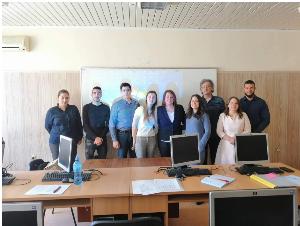
Секция „Аграрни науки -2“