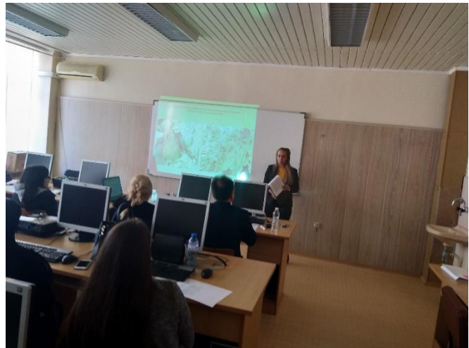
Секция „Аграрни науки – 1“

Комисията от втората секция класира следните студенти и доклади: